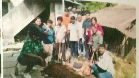
विशेष हिवाळी शिबीर, मु.पो. बेलावडे श्रमदान