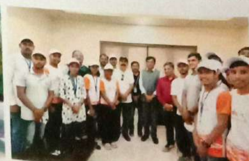
डॉ. मनसुख मांडविया, युवक कल्याण व क्रिडा मंत्री भारत सरकार विद्यार्थ्यांशी संवाद