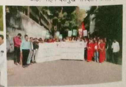
संत गाडगेबाबा जयंती निमित्त रॅली