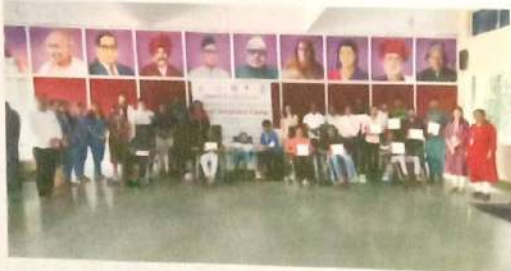
छत्रपती शिवाजी महाराज जयंती निमित्त रक्तदान शिबीर