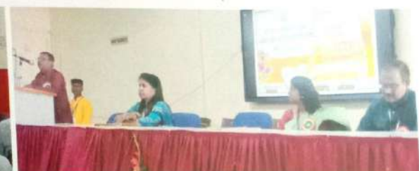
हिंदी दिवस निमित्त व्याख्यान