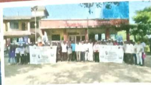
स्वच्छता ही सेवा उपक्रम मु.पो. बेलावडे ता. मुळशी