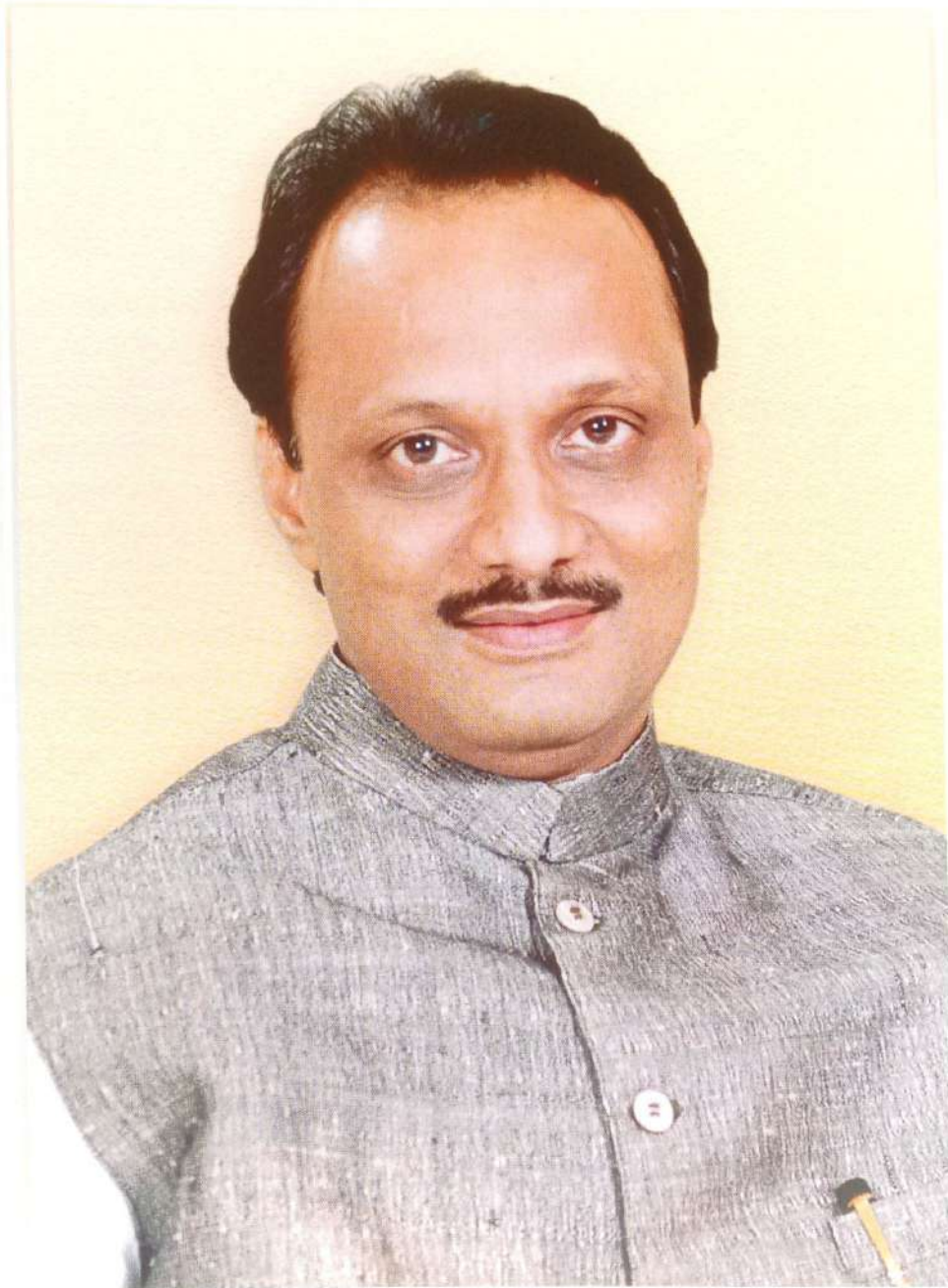
Honorable Ajit Pawar

Deputy Chief Minister Maharashtra State President Pune District Education Association