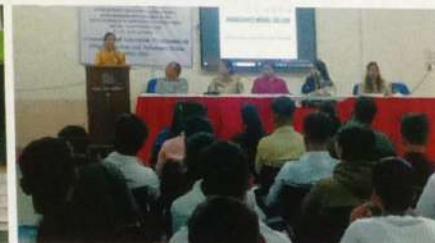
व्यसन आणि तान तनाव व्यवस्थापन कार्यशाळा