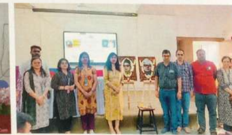
अर्थशास्त्र विभागा मार्फत बजेट २०२५ चर्चासत्र व पोस्टर प्रदर्शन