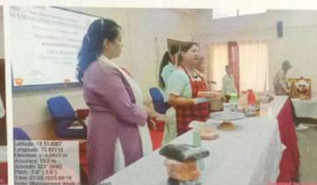
व्यवस्थापन सप्ताह अंतर्गत केक मेकींग कार्यशाळा