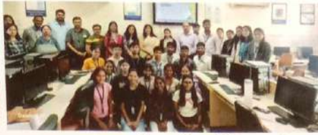
विज्ञान दिवस निमित्त महाविद्यालयाचे विद्यार्थी प्रकल्प सादर करताना