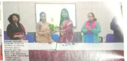
आजीवन अध्ययन अंतर्गत आरोग्य व आहार कार्यशाळा