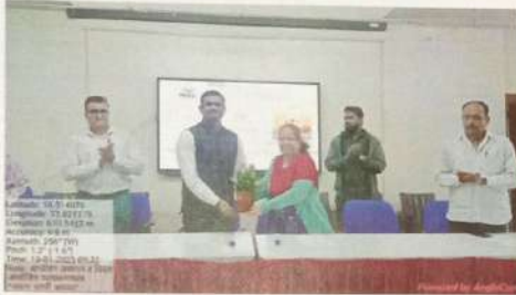
समान नागरी कायदा या विषयावर व्याख्यान