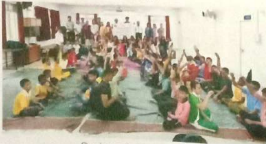
दिव्यांग मुलांबरोबर रक्षाबंधन, अंध मुलांची शाळा, कोरेगावपार्क