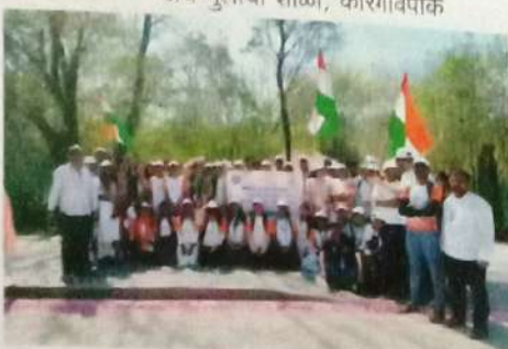
छत्रपती शिवाजी महाराज जयंती निमित्त पदयात्रा