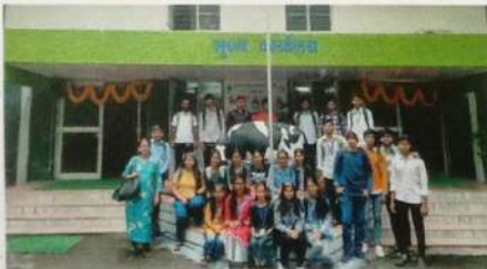
प्रथम वर्ष वाणिज्य क्षेत्र भेट, कात्रज डेअरी, पुणे