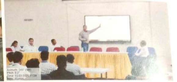
नविन तंत्रज्ञानाबद्दल माहिती देताना माजी विद्यार्थी