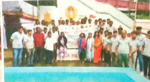
एस.एम. जोशी पुल मुठा नदिपात्र निर्मात्य व गणेश मुर्ती संकलन