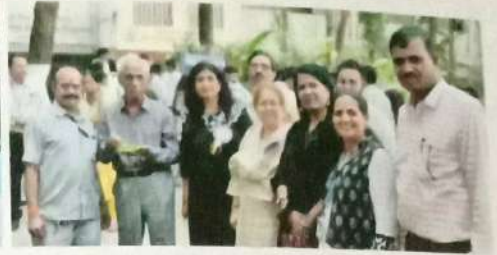
उद्योजकता विकास समिती मार्फत विद्यार्थी व्यावसाय मेळावा