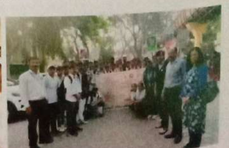
विश्व मराठी संमेलन २०२५ शोभा यात्रा व ग्रंथ दिंडी