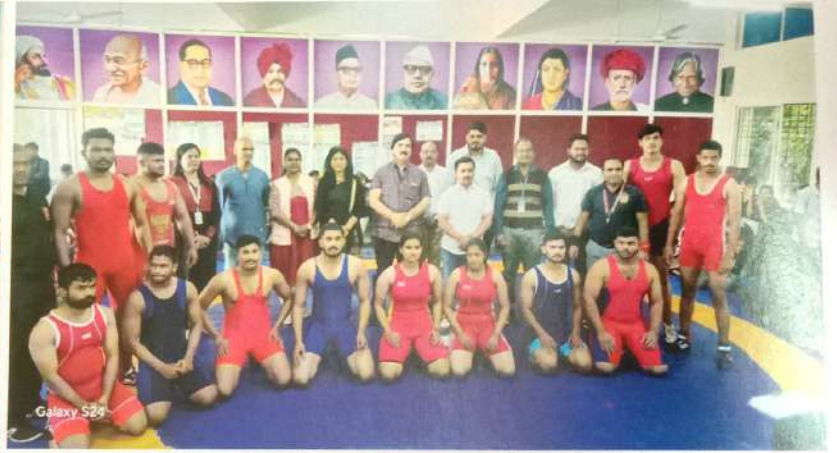
पुणे जिल्हा शिक्षण मंडळ आयोजित जिल्हास्तरीय कुस्ती स्पर्धेचे आयोजन