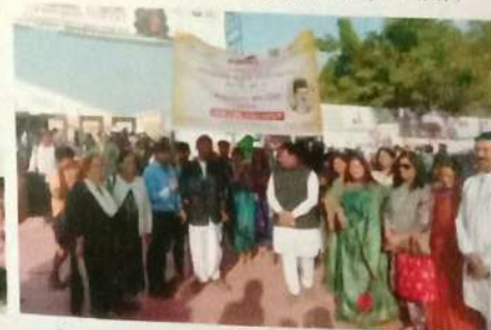
पुणे पुस्तक महोत्सव अंतर्गत ज्ञानसरीत ग्रंथ दिंडी