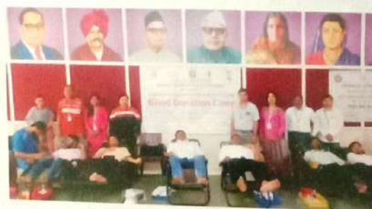
मा.ना.अजितदादा पवार यांच्या वाढदिवसानिमित्त व ऑगस्ट क्रांती दिन निमित्त रक्तदान शिबीर