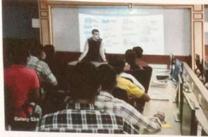
नविन अभ्यासक्रमानुसार तज्ञ व्यक्तींची कार्यशाळा