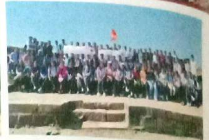
किल्ले लोहगड येथे एन.एस.एस. मार्फत स्वच्छता अभियान