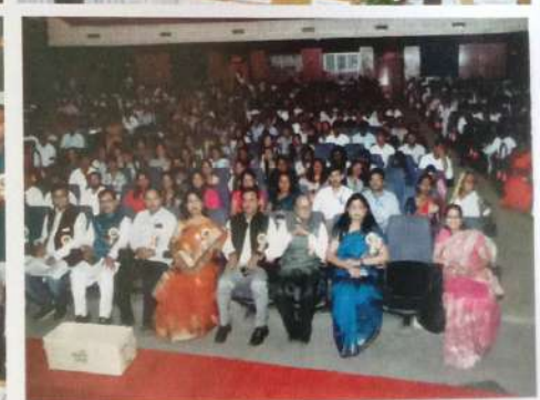
वार्षिक स्नेहसंमेलन व पारितोषिक वितरण समारंभ