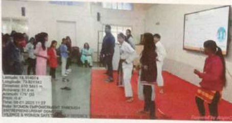
स्व संरक्षण प्रशिक्षण कार्यशाळा