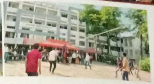
अंतरवर्गीय क्रिडा स्पर्धा २०२४-२५