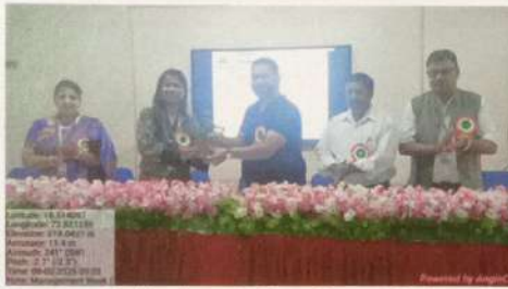
प्लेसमेंट सेल अंतर्गत करीअर मार्गदर्शन