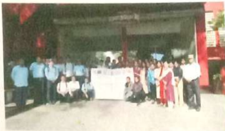
पाच दिवशीय नागरी संरक्षण प्रशिक्षण अंतर्गत एरडवणे अग्नीशमन केंद्र भेट