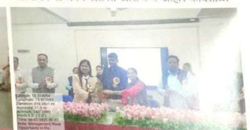
व्यवस्थापन सप्ताह अंतर्गत शेअर मार्केट मधील झधी