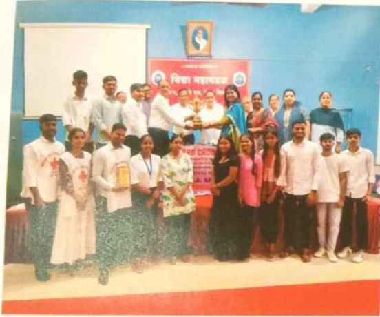
सलग तिसऱ्या वर्षी इंडियन रेड क्रॉस सोसायटीचा उत्कृष्ट महाविद्यालय पुरस्कार