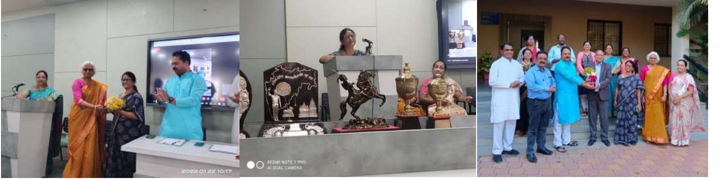
मराठी भाषा गौरव दिवस