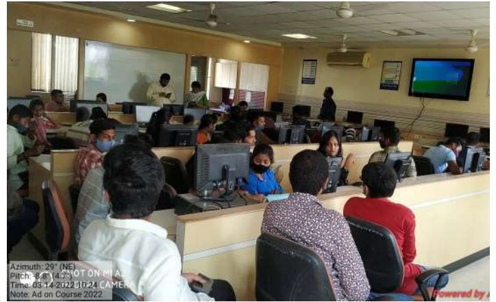
Add on course