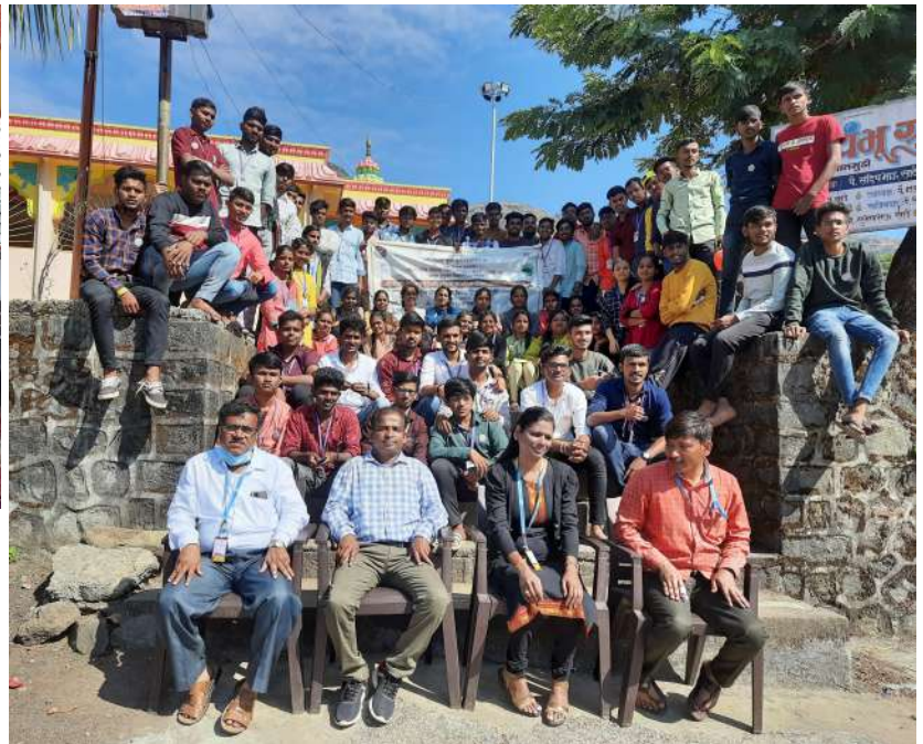
NSS Bhalgudi Special Camp