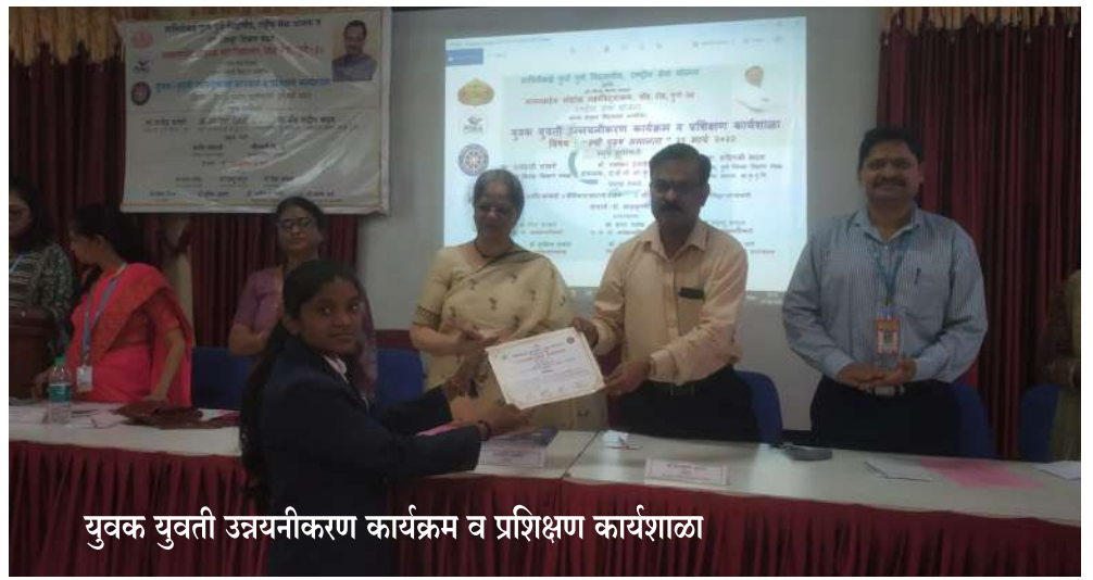
युवक युवती उन्नयनीकरण कार्यक्रम व प्रशिक्षण कार्यशाळा