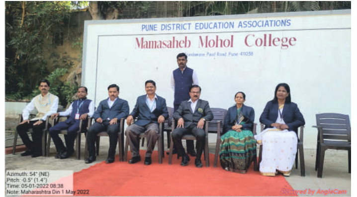
UGC Research Committee