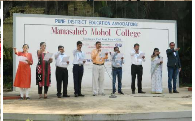
Indian Constitution Day