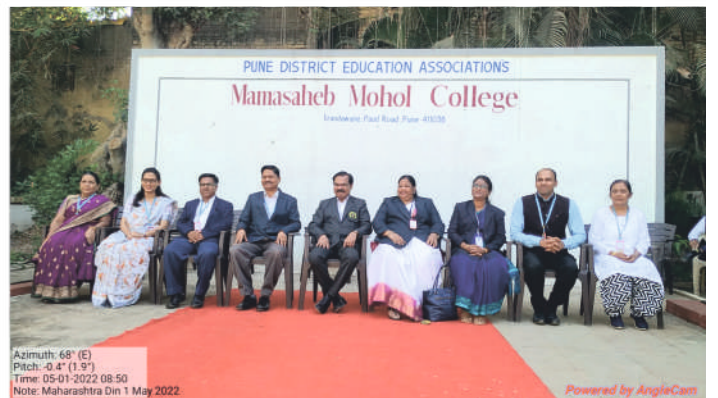
Life Long Learning and extension