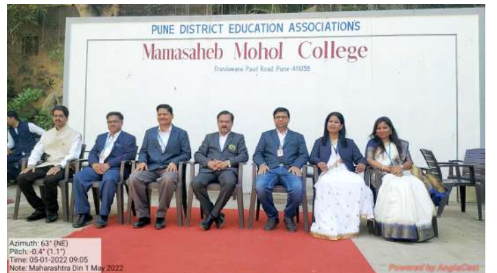
Parent Teacher Association