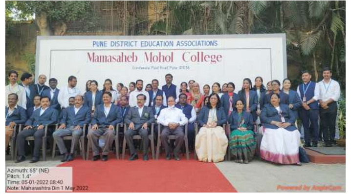
All Teaching and Non Teaching Staff