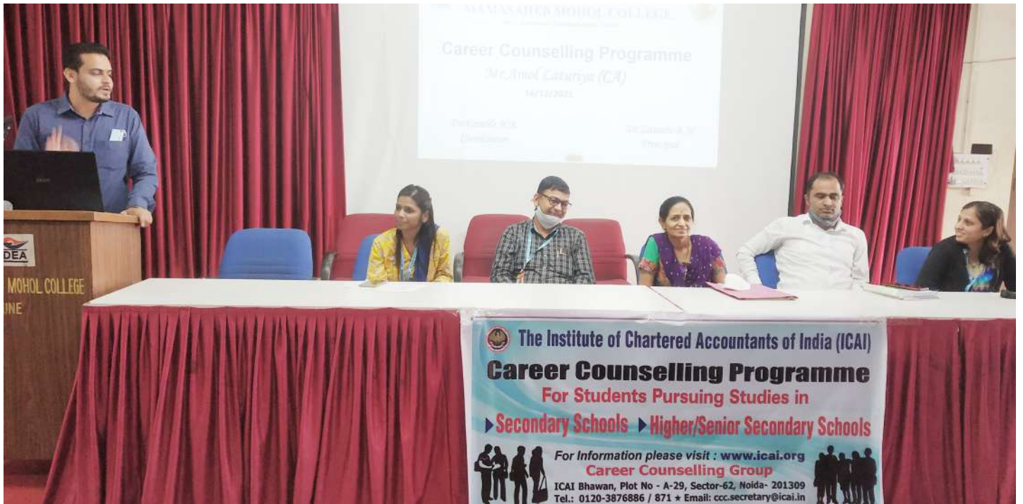
Career Counselling Program organised by ICAI