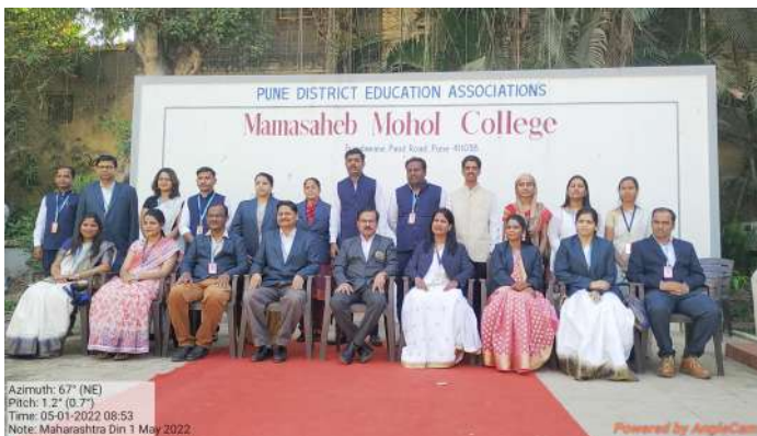
Add on Course Committee