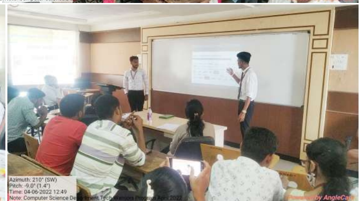
Anti-Ragging Cell & Student Development Board : Tech Warriors Program 2022